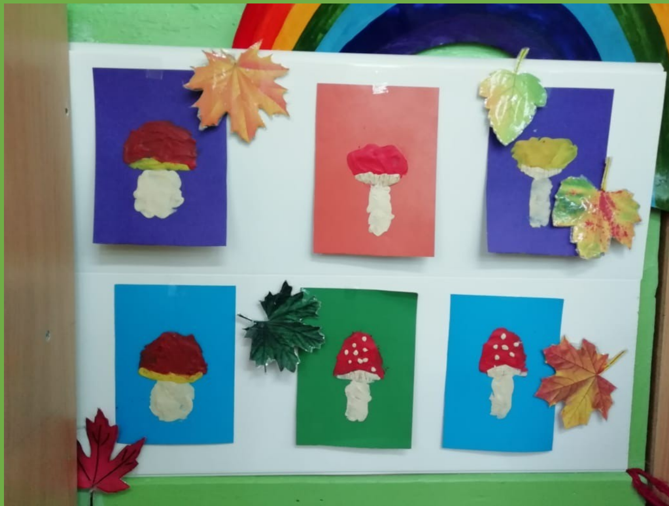
Пластилинография по произведению «Круглый год»