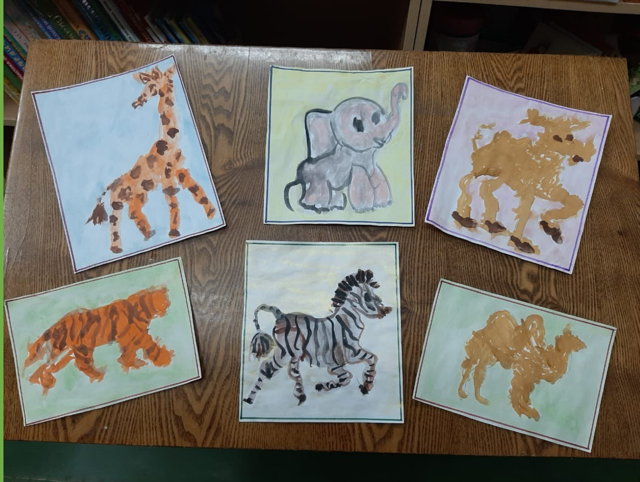
Рисование по мотивам «Детки в клетке»