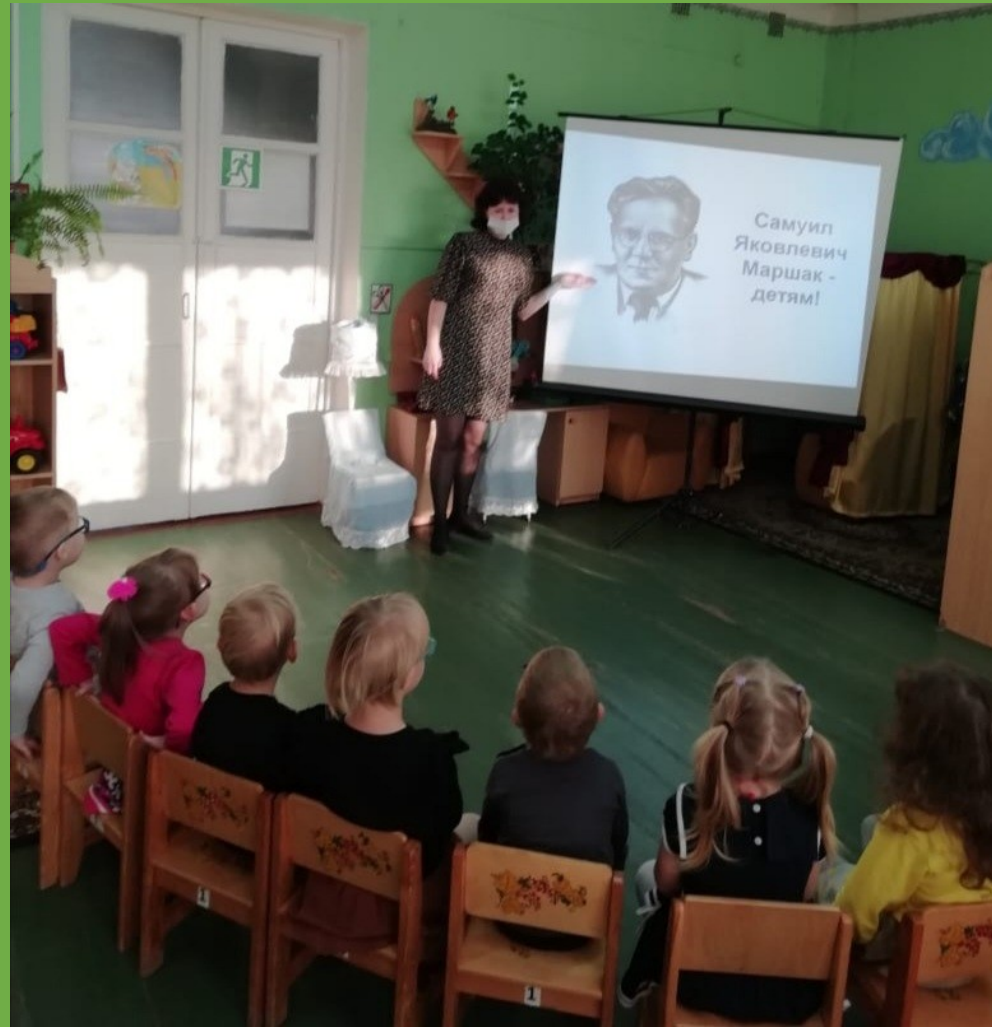
Просмотр презентации «С. Я. Маршак - детский поэт и сказочник»