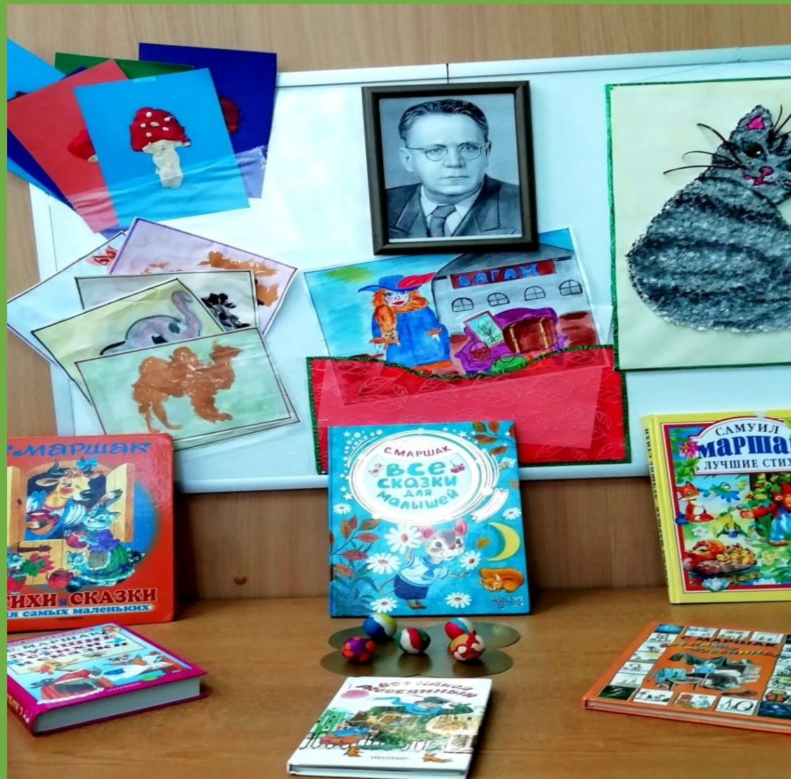
Уголок по проекту